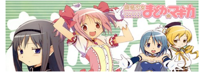
魔法少女まどか☆マギカ