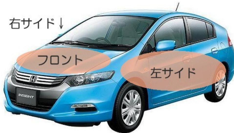
ホンダ;インサイト

フロント・両サイドに オタク向け 萌えアニメキャラのイラスト、 ちゃんと入ります。